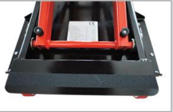
Functional chassis design for easy cleaning / Kolay temizlik sağlayan tasarım