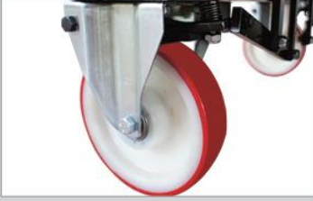
Auto braking on castors Tekerek üzeri otomatik fren