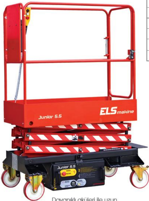
Dayanıklı aküleri ile uzun süre kullanabilme / Outstanding battery capacity provides long endurance Kompakt tasarım / Compact design