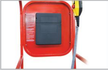
Operator briefcase Operatör evrak çantası