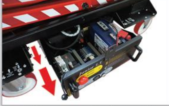
All the component parts are easily accessible for servicing Tüm ekipmanlara kolayca erişebilme ve bakım kolaylığı